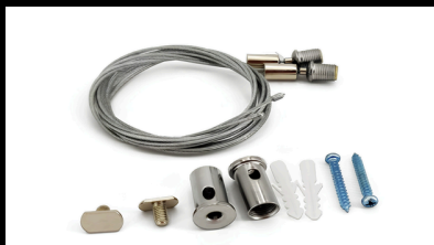
Kit de suspension pour câble